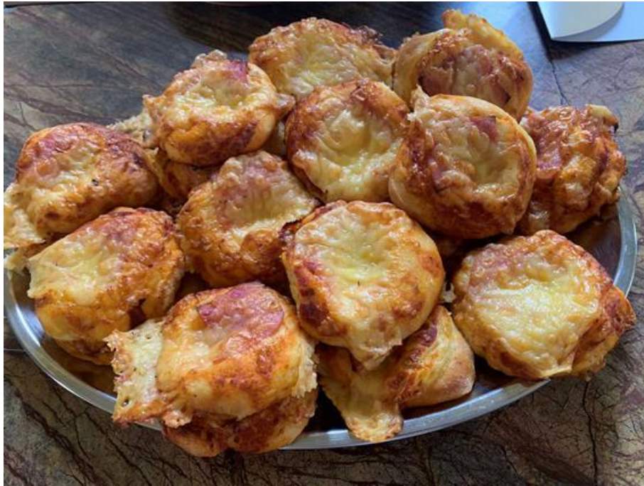
Μπουφές - Ελαφρύ Γεύμα (finger food)